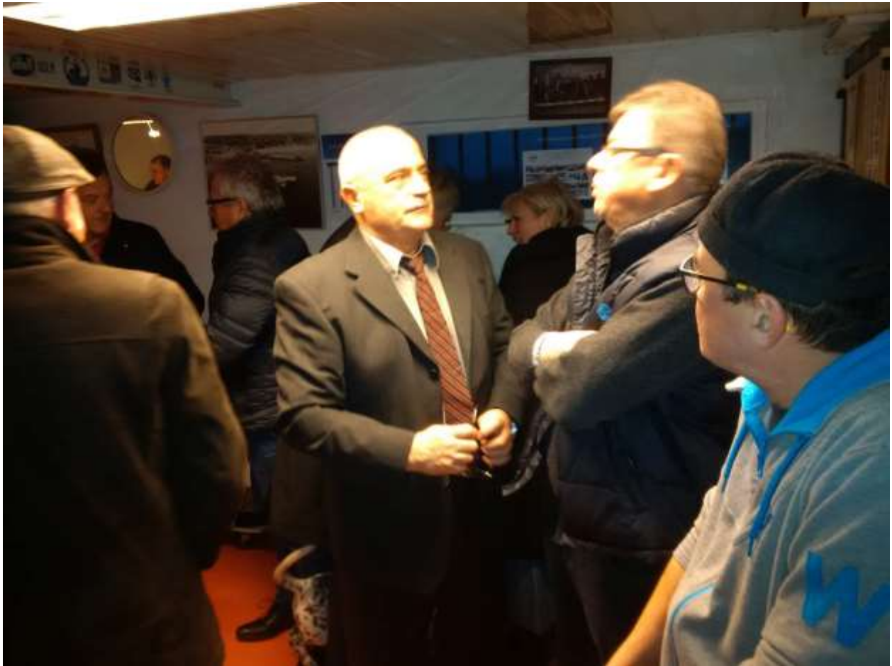
Le bureau des inscriptions ...